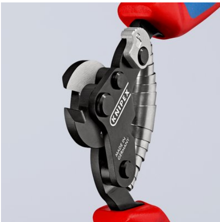
Scharnier met dubbel lager