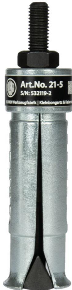
IMAGE DE CANDIDATURE