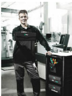
Wera 2go 3 - het ruimtewonder