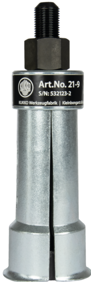
IMAGE DE CANDIDATURE