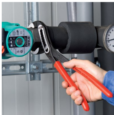
Autobloquante sur tubes et écrous: moins d'effort; l'intégralité de la force appliquée peut être utilisée pour faire tourner la pièce; inutile de trop serrer les poignées de la pince, effort nécessaire réduit