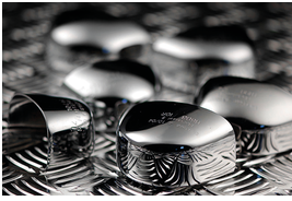
Embout en acier