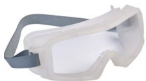
COVACLAVE ORIGINE: TW