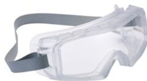
COVACLEAN ORIGINE: TW