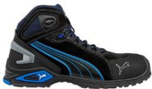
RIO BLACK MID 632250