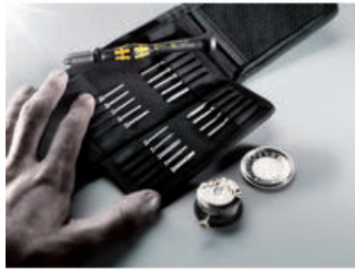
Kraftform Micro ESD-bitshandhouder